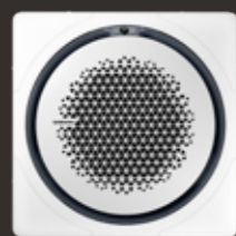
White square panel