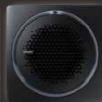
Black square panel